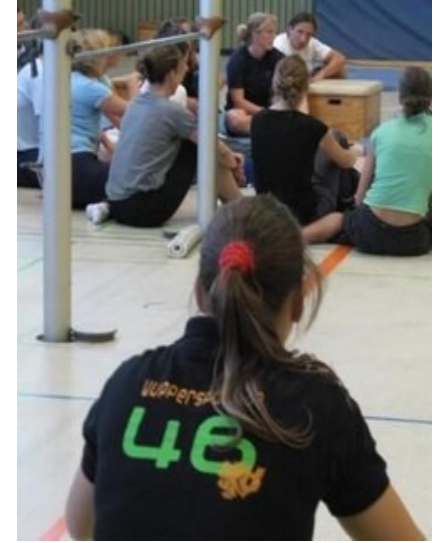
Grafik: Beese

„Sei du selbst die Veränderung, die du dir wünschst für diese Welt.“ (Mahatma Gandhi)