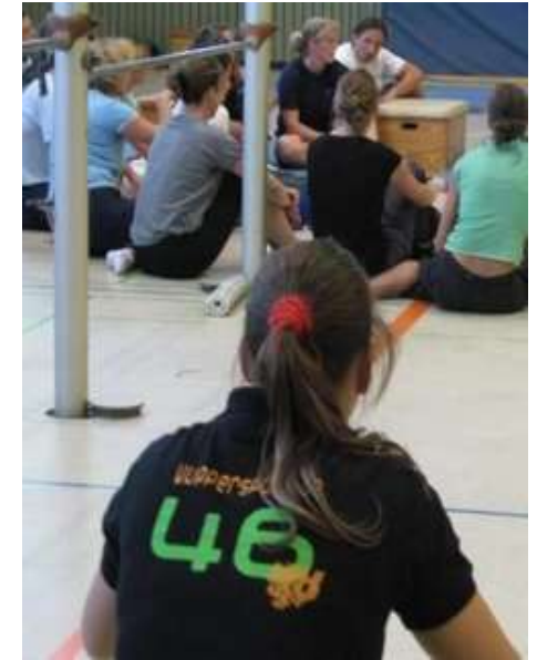
Grafik: Beese

„Sei du selbst die Veränderung, die du dir wünschst für diese Welt.“ (Mahatma Gandhi)